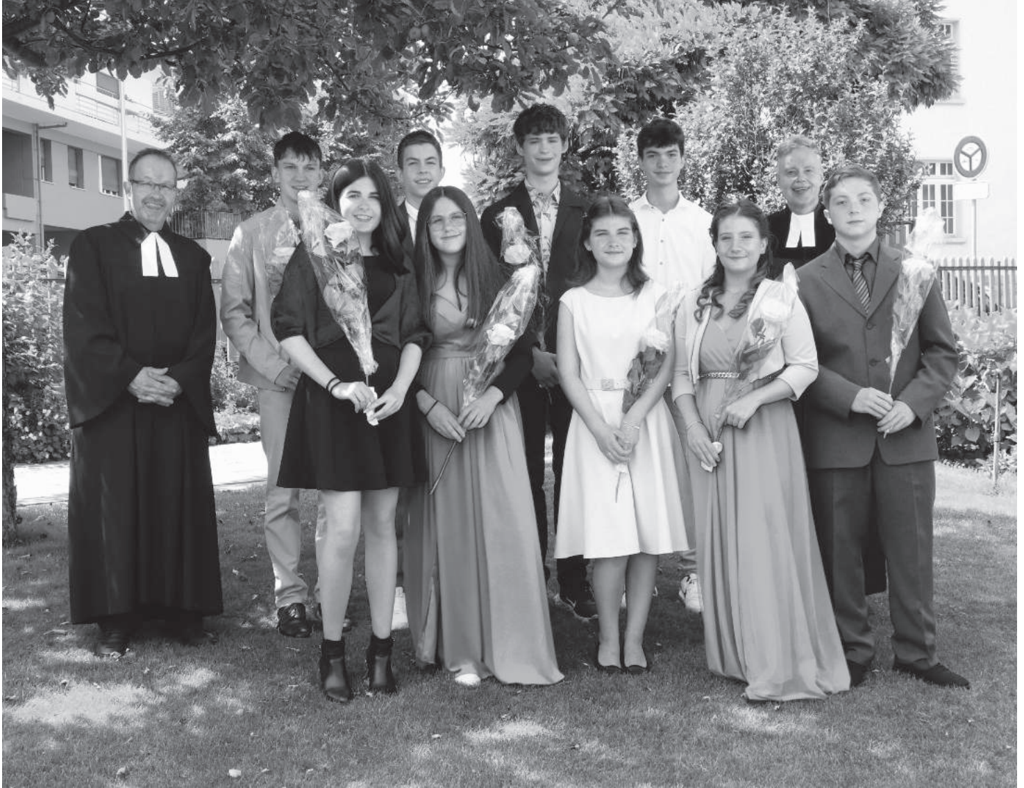
Konfirmanden im Jahre 2022